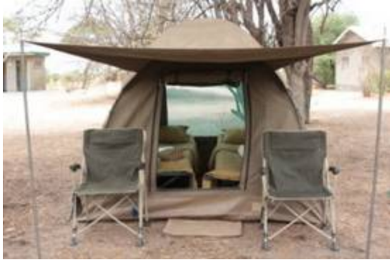
Camping Safari Zelt

Nach dem Frühstück fahren Sie über den Grund des Großen Grabenbruches (Great Rift Valley) zum Lake Manyara National Park. Elefanten, Giraffen, Büffel, Zebra und eine Vielzahl von Antilope bewohnen den Park sowie eine Vielzahl von Affen und einer große Population von Flusspferden. Mit etwas Glück sehen Sie Löwen, bekannt für ihre Gewohnheit in diesem Park auf Bäume zu klettern, und dort träge auf den Ästen von Bäumen ruhen. Die Vogelwelt ist ebenfalls reich an Flamingos, Pelikanen, Nashornvögel und viele im Wald lebende Tierarten. Übernachtung auf einem Campingplatz am Lake Manyara . Alle Mahlzeiten inbegriffen.